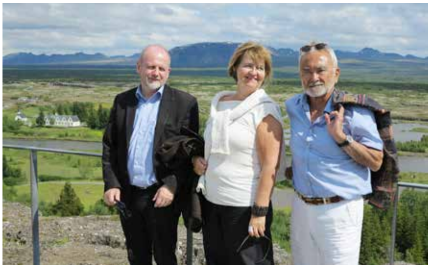
Inatsisartut siulittaasui: Lagtingip siulittaasua Jógvan á Lakjuni, Altingip siulittaasua Ásta R. Jóhannesdóttir nunatsinnilu Inatsisartut siulittaasuat Josef Motzfeldt.

Savalimmiunit, Islandimit Kalaallit Nunaanniillu Inatsisartut siulittaasui ukiumut ataasiarlutik naapittarput, Ukioq manna ataatsimiinneq Islandimi ulluni 26. aamma 27. juni ingerlanneqarpoq. Islandimit Altingip siulittaasua Ásta R. Jóhannesdóttir peqataavoq. Savalimmiunit Lagtingip siulittaasua Jógvan á Lakjuni peqataalluni. Siulittaasut ataatsimiinnerminni inatsisartuni ataasiakkaani sulineq pillugu ilisimateqatigiittarput misilittakkanillu ilaatigut inatsisartuni pingasuni suliniutit nutaat pillugit paarlaasseqatigiittarput. Ataatsimiinnerit nunani ataasiakkaani paarlakaajaallugit ingerlanneqartarput, tullianillu ataatsimiinnissaq Kalaallit Nunaanni 2013-imi ingerlanneqassalluni.