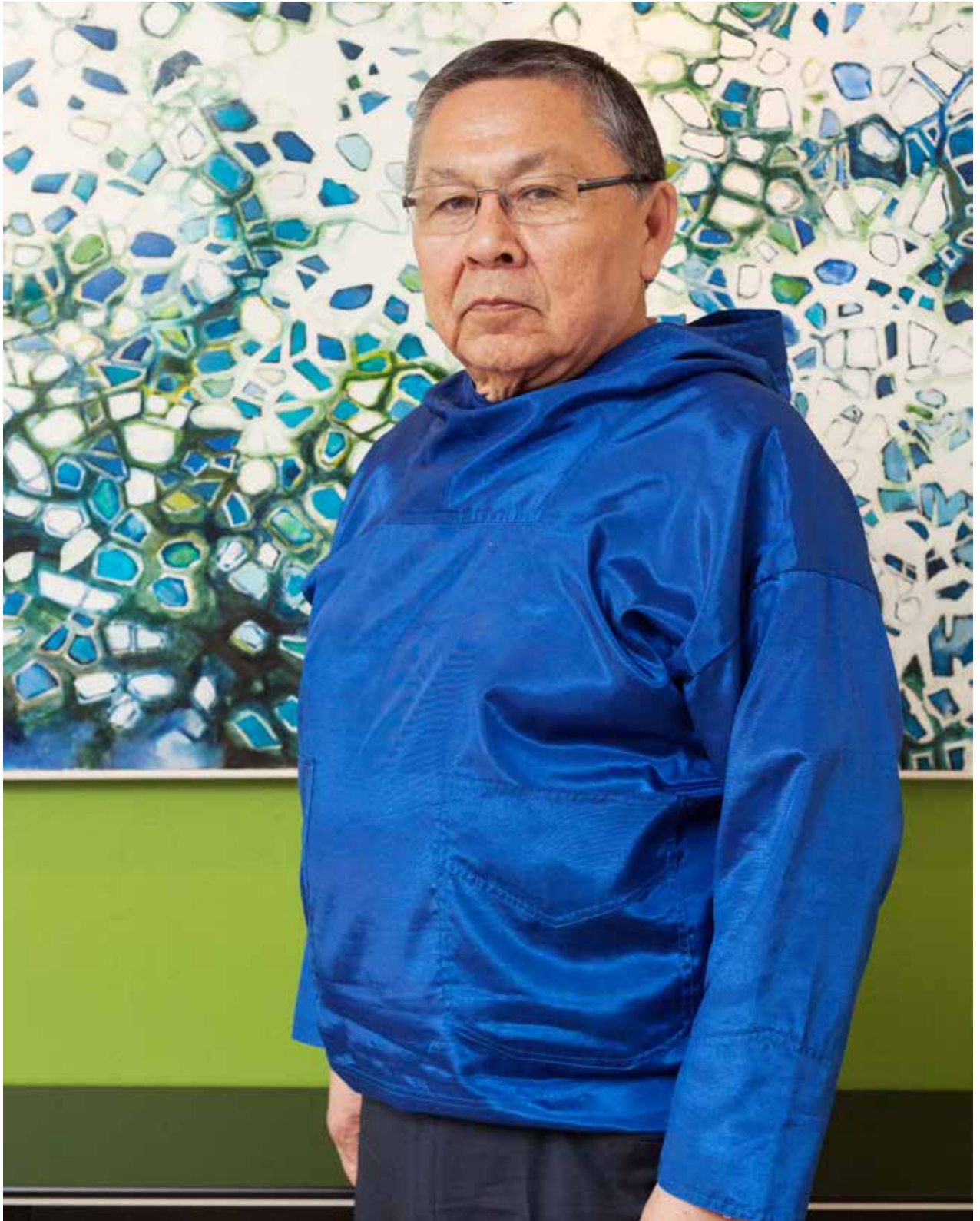
Inatsisartut Siulittaasuat Lars-Emil Johansen.