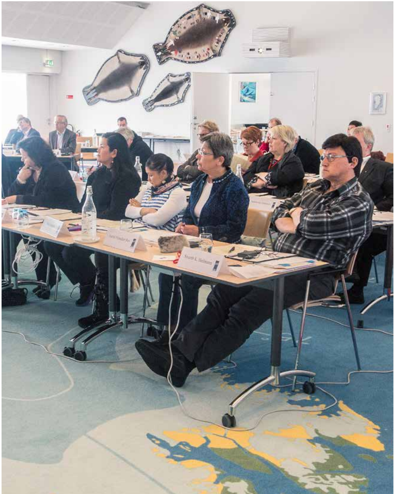
Nunat Avannarliit Killiit Siunnersuisoqatigiiffiata Ilulissani 27.-30. marts aalajangersimasumik qulequtaqartitsilluni ataatsimeersuartitsineranit.