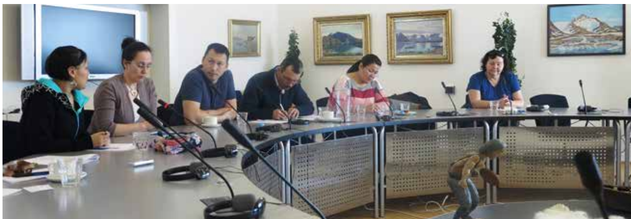
Qaasuitsup Kommunanut 20. - 26. marts paasisassarsiorluni angalaneq.

12. oktober: Ataatsimiititaliaq Ilimmarfimmud persuarsiornanngitsumik qaaqquusaanera suullu ilinniarneqartarnersut pillugit saqqummiussisoqarluni.