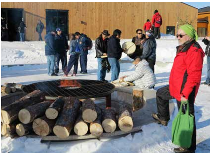
Arctic Winter Games innerata pisortatigoortumik ikinneqarneranit.

Timersuutit assigiinngitsut, soorlu Inuit pinnguaataannik unammiaarnernut, nunatta Alaskallu isikkamik arsarlutik unamminerannut, taamatullu aamma nunatta Albertallu volleyballimik unamminerannut Inatsisartut Siulittaasuat malinnaavoq. Inatsisartut Siulittaasuat taamatuttaaq unammiaarnerit ingerlanneranni pisunut pisortatigoornerusut peqataavoq. Aaqqissuussinerit taakku ilagaat unammiaarnerit "innerata" nunap immikkoortuani tamatumani nunap inoqqaavisa kulturikkut illorsuartaavata nutaap silataani ikinneqarnera.