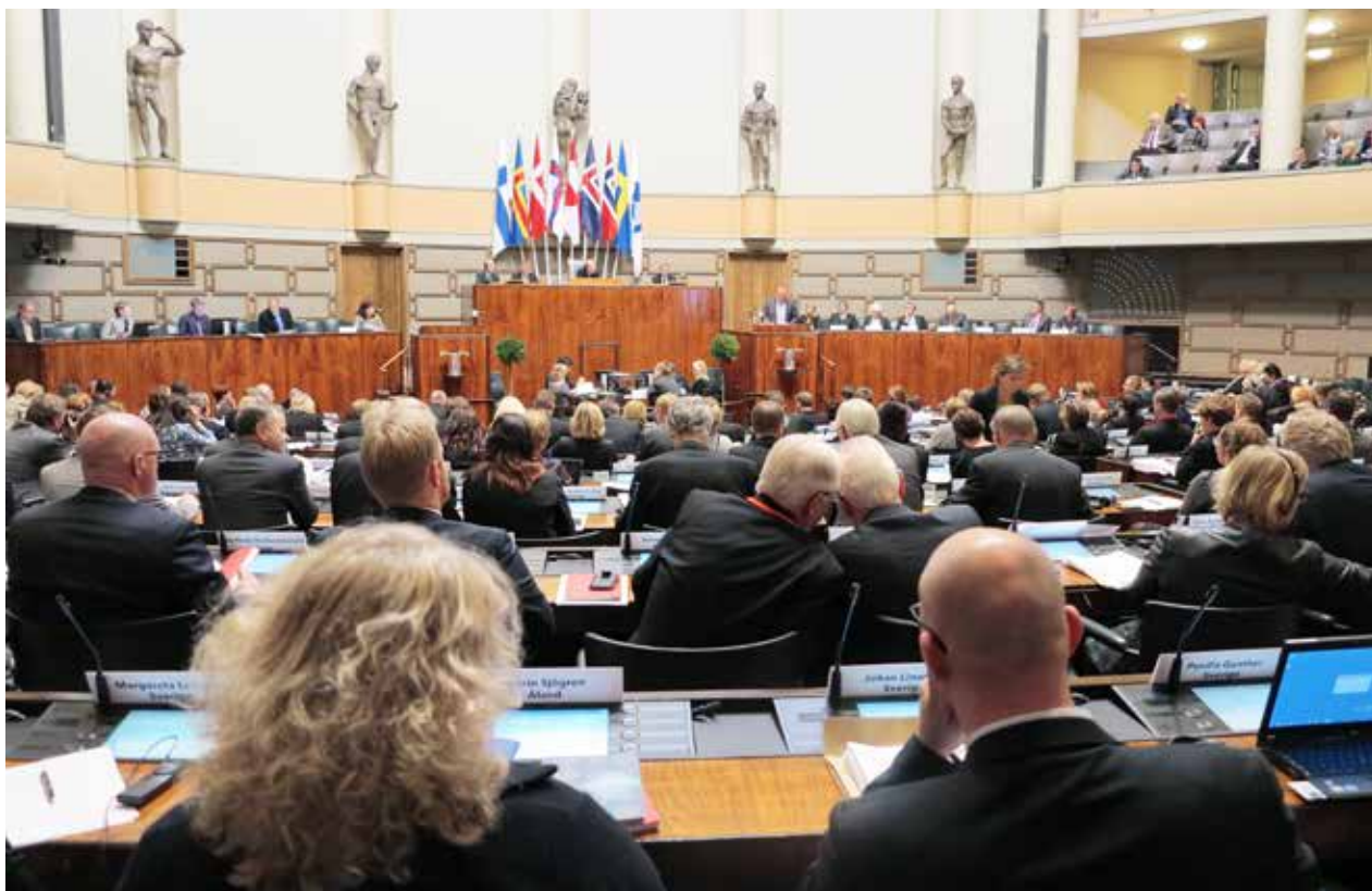
Nunat Avannarliit Siunnersuisoqatigiiffiata Finlandimi Helsingforsimi 64-issaanik ataatsimiinnera.

31. maj - 1. juni: Avatangiisinut Pingortitamilu Pisuussutinut Ataatsimiititaliamit aallartitatut Nunat Avannarliit Siunnersuisoqatigiiffianni ilaasortaasoq Kim Kielsen suliffeqarfissuarmut Tuluut Nunaata avannaata kippasissuaniittumut Sellafieldimut paasisassarsiorluni nalunaarusiuteqariartorlunilu alakkarterinerumut peqataavoq. Sellafield suliffissuaqarfiuvoq Tuluut Nunaanni nunanilu allani atomimik nukissiorfiit ikummatikuinik pinngoqqaataannut immikkoortiterinermik suliaqarfiusoq. Sellafield ukiuni arlalissuarni Nunat Avannarliit Siunnersuisoqatigiiffiannit annertuumik eqiingaffigineqarsimavoq, Pisortanik Sellafieldillu suliffissuaqarfianik piginnittuusut aallartitaannik piffissap ingerlanerani ingerlaavartumik oqaloqatigiiffiusunik Nunat Avannarliit Siunnersuisoqatigiiffiat ataatsimeeqateqartarpoq. Nunat Avannarliit Siunnersuisoqatigiiffiata aarlerissuteqarnera Sellafieldimi suliffissuaqarfiup atlantikut avannarpassisuanik raatiup qinngualaneranik mingutsitsineranut sammivoq. Oqaloqatigiiffiusumik paasisutissiivigeqatigiillunilu ataatsimiittarnerit siunissami ingerlaavartussatut takorloorneqarput.