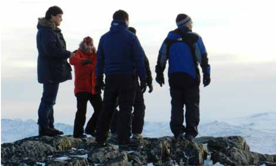
Tasersiap eqqaani ataatsimiititaliamut ilaasortat paasisassarsiortut.

sarnermut, Piniarnermut Nunalerinermullu Ataatsimiititaliaq peqatigalugit, suliffeqarfiup aningaasaqarnikkut inissisimaneera, ingerlatsinera, periusissatut pilersaarutai kiisalu nunat tamalaat akornanni ingerlatai pillugit, Royal Greenland A/S-imit aallartitanik, paasisutissiivigeqatigiiffiusumik ataatsimeeqateqarneq.