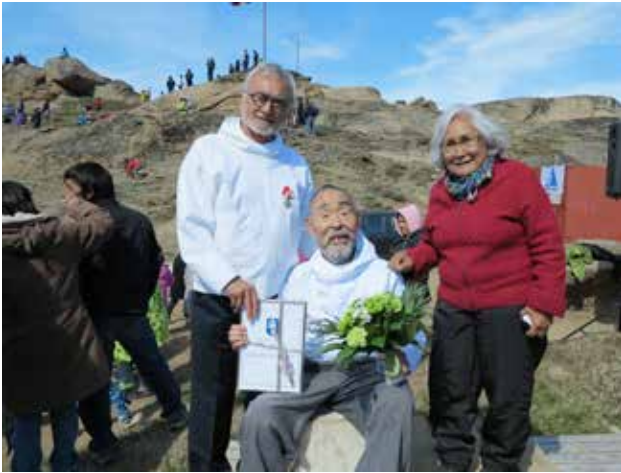
Gerth Pivât sølviusumik nersornaaserneqarpoq.