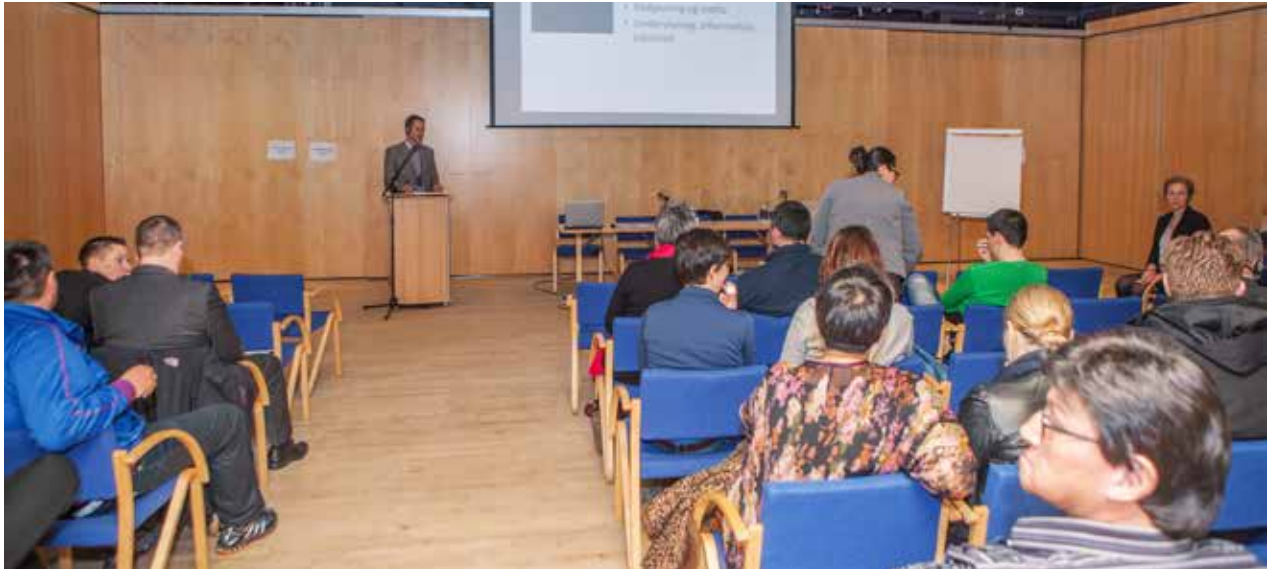
Katuami inuttut pisinnaatitaaffiit pillugit isumasioqatigiinneq.

kissaateqaraangat. Inatsisartunit namminermit siornatigut qaaqquneqarsimangillat, taamaattumillu aamma qaaqquneqarsimanertik assut nuannaarutigeqalugu.