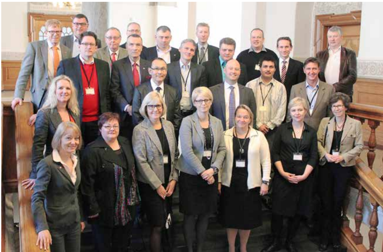
Inatsisartutigoortumik kukkunerisiisarnermut nunat avannarliit attaveqatigiittarfianni Københavnimi ataatsimiinnermit.