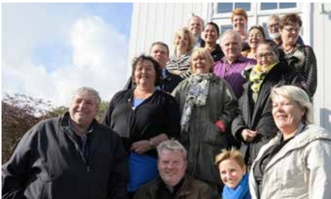
Nunat Avannarliit Killiit Siunnersuisoqatigiiffiannut aallartit Tórshavnimi inatsisartut Lagtingip silataanni.