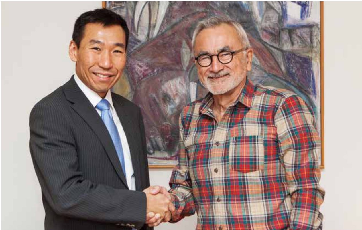
Ulloq 6. november Australiap ambassadøriata Mr. James Choi-ip Inatsisartut pulaarpai.

Ambassadørinit tamarmik pinngortitami pisuussutiniq iluaquteqarniarnermi peqataasinnaanermut periarfissat kiisalu nunat Issittumi Siunnersuisoqatigiinnik qaninnerusumik suleqateqarusunnerat immikkut sammerusussimavaat.