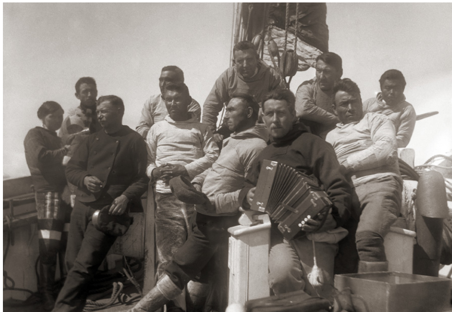
Kujataata Landsrådianut ilaasortat ataatsimiigiartut palasit ajoqillu peqatigalugit umiarsuaaqamut motorilimmut "Bjørnen"-igunartumut ilaallutik.

Landsrådit sumi ataatsimiittassanersut Kalaallit Nunaanni Landsrådit pillugit peqqussummi aalajangersarneqarsimapput, taakkulu Paarsisoqarallannerani naalagaasarsimasut qullersaqarfiisa inissisimaffigisimasaat assigalugit. § 8-mi oqaatigineqarpoq: "Nalinginnaasumik Kujataata Landsrådia Nuummi katersuuttassaaq Avannaatalu Landsrådia Qeqertarsuarmi. Immikkulli pis-sutissaqartillugu taamaattoq Siulittaasut Landsrådit nunap immikkoortuani sumiiffimmut allamut ataatsimiigiaqqusinnaavai." Taamatut sanioqqutsisinaanermik periarfissaq Landsrådit akuttunngitsumik atortarsimavaat. Assersuutigalugu niuertorseqarfik Uummannaq Avannaata Landsrådiata marloriarluni ataatsimiiffigisimavaa, Kujataata Landsrådia ataasiarluni Nanortalimmi ataatsimiittoq, pisumilu allami Nuummi tuniluuttumik nappaalasoqarnerani Nuuk kujataani nunaqarfimmi Narsami ataatsimiittoqarluni.