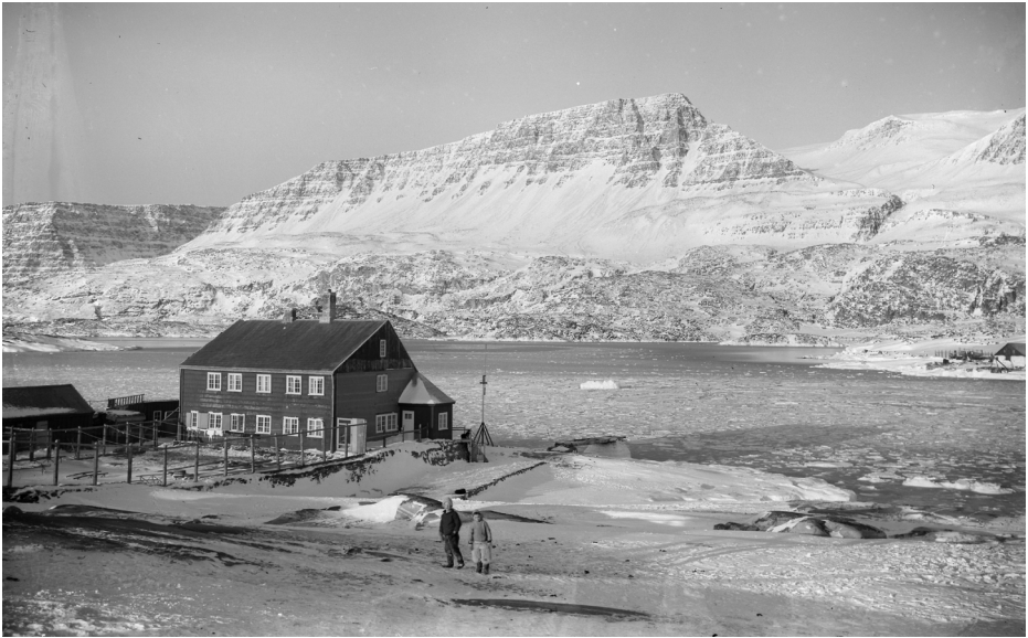
Qeqertarsuarmi Landsfogedip illorsua 1917-imi.