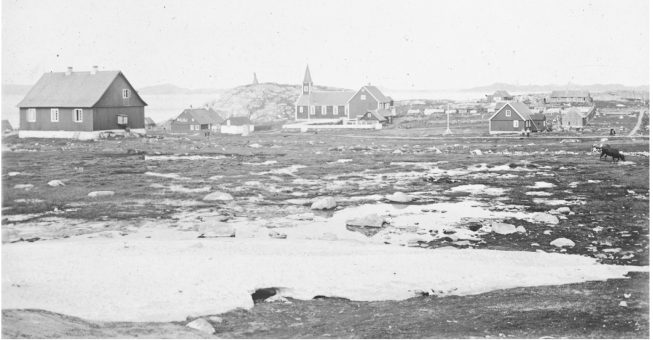
Nuuk 1921-miussagunartoq. Illu saamiatungaaniittoq tassa napparsimnavitoqq. Tunuatungaani Annaassisitta Oqaluffiata saavani Landsfogedip illorsua inissisimavoq.

Landsrådinut ilaasortat immikkut qinersivinni kommunerådinut ilaasortanit kalaallinit tassani najugalinnit ukiuni arfinilinni atuuttussamik qinerneqartarput. Taamaattumik taamatut aaqqissuussineq pissutigerpiarlugu nutaamik qinersisoqarnerit tamaasa annertuumik taarseraasoqartarpoq. Ilaasortat aqqaneq-marlunnit amerlaneroqqusaangillat. Qinersisussalli qulinit amerlanerukkajungillat, taamaattumillu Landsrådit arlaanni ilaasortaaneq qinersisussat akornanni paarlakaattussatut erseqqissumik isigineqarsimalluni.