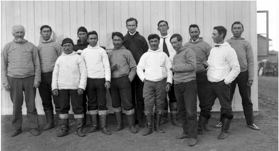
Avannaata Landsrådia 1929-imi Qeqertarsuarmi Angakkussarfiup saavani. 1911-imi rådip ataatsimiinneranit siullermit assimik nassaarsinnaasimangilagut.

pilersitsinissaq, peqatigiilluni ammassanniartarnissaq, inuit handelimi, allaffeqarfinni ilageeqarnermi atuarfeqarnermilu sulisut ajutooriataarsinnaanerinut sillimmasiisarneq pillugu malittarisassat, kalaallit illuinik nutaamik sananermi allannqortiterinermiluunniit sanaartornermut taarsigassarsisarneq tapiis-suteqartarnerlu, taamatullu aamma kommunerådinut qinersisinnaatitaaneq qinigaasinnaatitaanerlu pillugit malittarisassanik aalajangersaaneq.