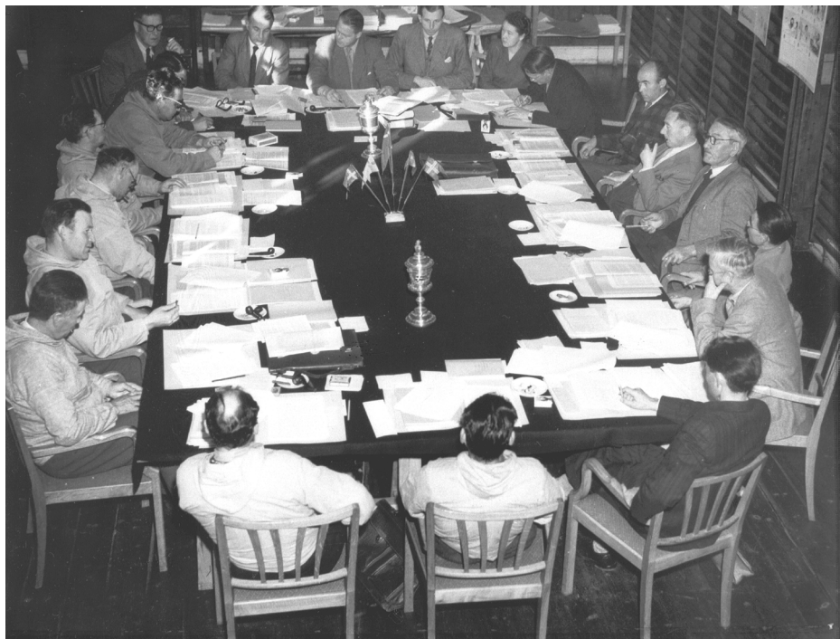
1951-imi Landsrådit nalinginnaasumik inunnit qinikkat siulliit.

Ulloq 21. juni 2009 Kalaallit Nunaanni Namminersornerup eqqunneqarneratigut Kalaallit Nunaanni Namminersorneq pillugu Inatsimmi "Inatsisartut" pisortatigoortumik taaguutigitinneqalerput, aamma qallunaatut.