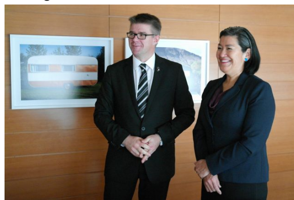
Aleqa Hammond med Islands udenrigsminister Gunnar Bragi Sveinsson, November 2013