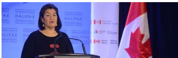
Aleqa Hammond taler ved Halifax Forum i Canada, November 2013

Formanden har således benyttet flere lejligheder, hvor hun var inviteret som taler, til at fremhæve Grønlands investeringspotentialer – blandt andet i Canada og i London. Ligeledes planlægges et officielt besøg i Japan i december 2014 også at have deltagelse af relevante erhvervsaktører til erhvervsrettede events under besøget.