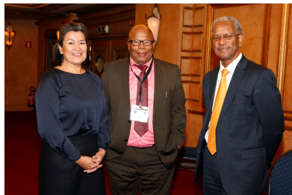
Aleqa Hammond med regeringscheferne fra Anguilla og De Britiske Jomfruøer, december 2013

en række særlige udfordringer i kraft af meget små økonomier, befolkninger og administrationer og er isoleret geografisk i forhold til EU. Samlet set udgør indbyggerne i OLT-medlemslandene i alt 1,2 mio. indbyggere. OLT-indbyggere regnes som statsborgere i et medlemsland samt EU-statsborgere.