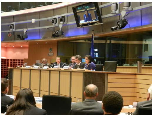
Aleqa Hammond til paneldebat i Europa - Parlamentet, december 2013

at de noterer sig de stærke relationer som EU har opbygget med Grønland og den geostrategiske interesse der ligger deri. Parlamentet anmoder Kommissionen og udenrigstjenesten om at undersøge hvordan EU-baseret forskning og teknologi samt private forretningsdrivende kan bidrage til den bæredygtige udvikling i Grønland.