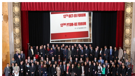
Deltagerne ved OLT-EU Forum december 2013

Rammeaftalerne der tilsammen udgør aftalerelationerne mellem Grønland og EU, blev i 2013 samt begyndelsen af 2014 færdigforhandlet, efter en årelang forberedelse og forhandlingsproces. Repræsentationen har været i meget tæt koordination med udenrigsministeriet, om færdiggørelsen af rammeaftalerne.