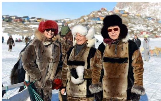
Aleqa Hammond sammen med den danske statsminister Helle Thorning-Schmidt og FN's generalsekretær Ban Ki-moon i Uummannaq, Marts 2014

De fortællinger og erfaringer, som Ban Ki-moon har erhvervet sig under besøget i Uummannaq, vil han benytte til at understøtte budskabet om, at det er på høje tid at nå til en global klimaaftale i 2015, der gælder fra 2020.