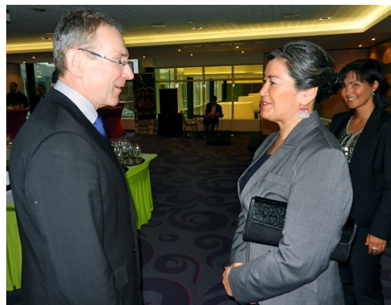
Aleqa Hammond med udviklingskommissær Andris Piebalgs, januar 2014

Da dette i efteråret 2013 stod klart for både Danmark og Grønland, gik et intensivt diplomatisk arbejde i gang. Dette for at sikre at afsatte midler til Grønland ikke skulle stå overfor en omfattende beskæring. En sådan ville opfattes som stik imod alle de intentioner som EU har oplyst af interesser overfor Grønland. EU ser Grønland som en respekteret aftalepart på OLT-området som i forhold til de vigtige fiskeriressourcer, og særligt som vigtig geopolitisk arktisk partner. Derudover har aftalerelationerne med Grønland over årene vist, at der er en styrket interesse i et samarbejde, som tager hensyn til de økonomiske udfordringer både Grønland som EU har.